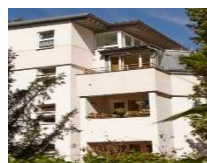
HEERSTRASSE BERLIN WESTEND