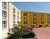
NEUSTADT AM RÜBENBERGE