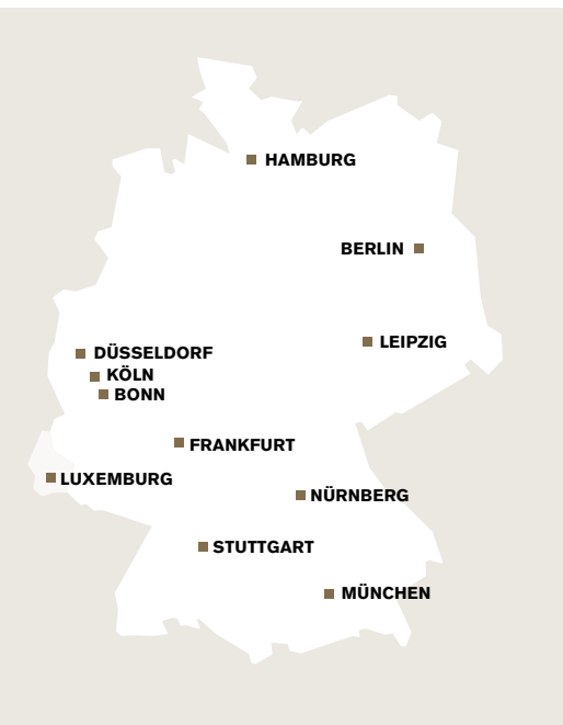
Unsere 11 Standorte in Deutschland und Luxemburg