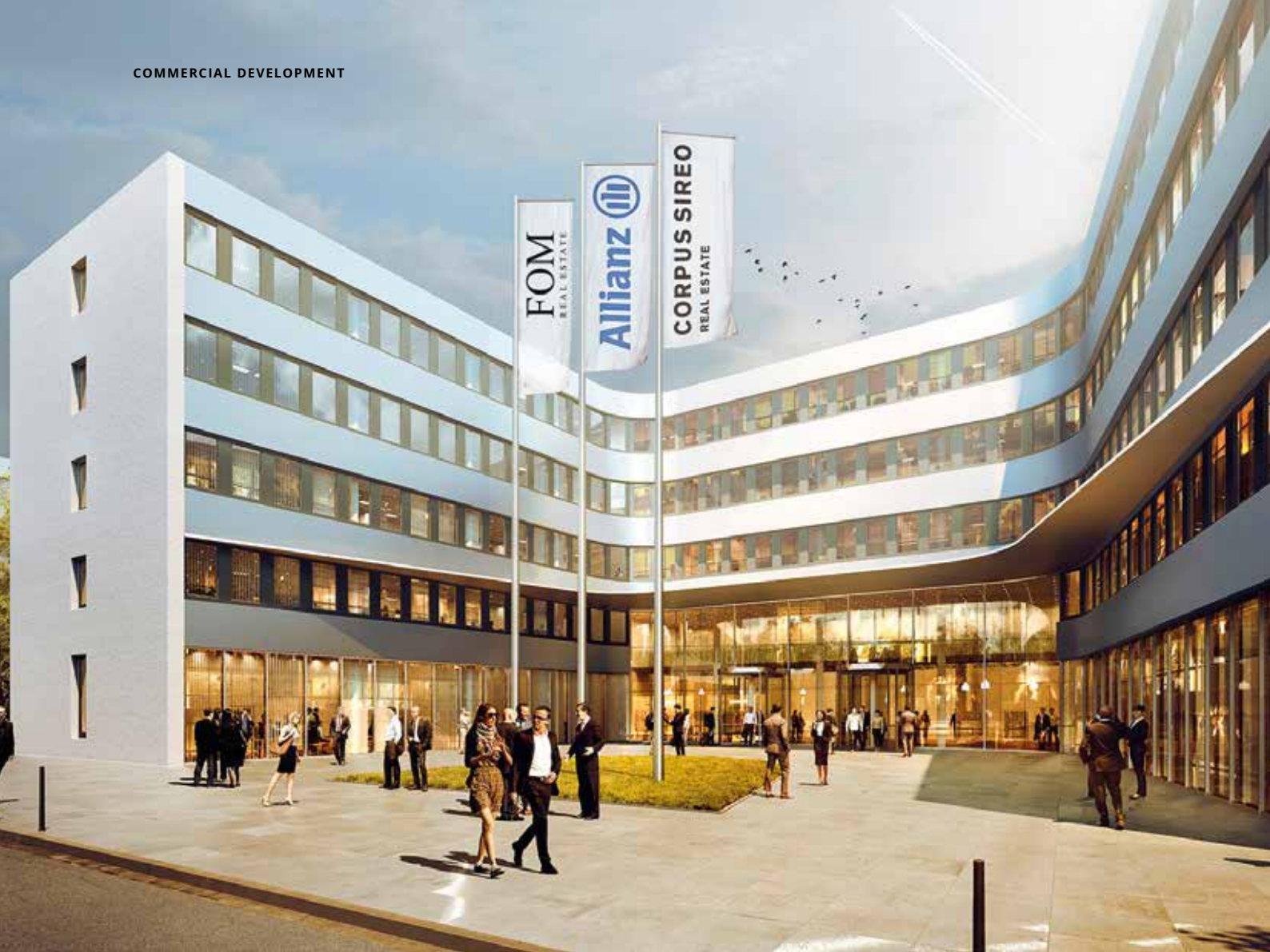
Allianz Campus, Berlin