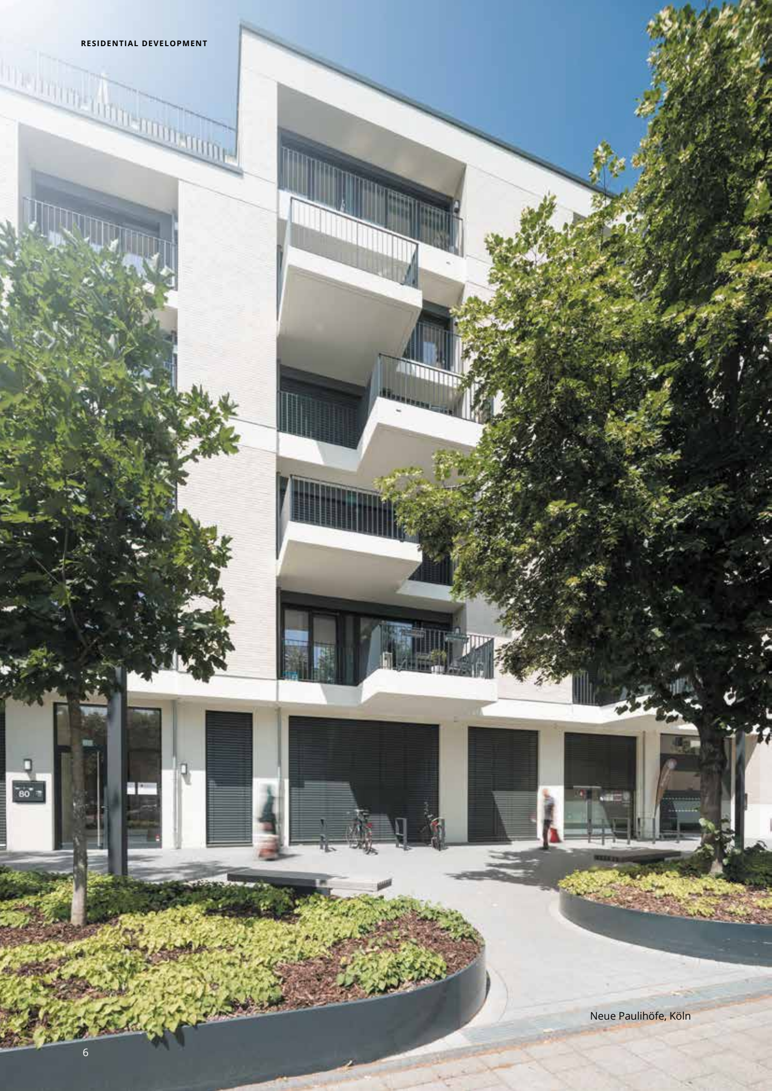
Neue Paulihöfe, Köln